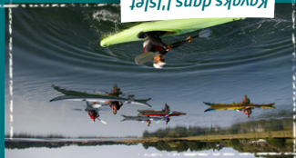
Kayaks dans l'Islet

Un écran de verdure dans un site exceptionnel ! Le tour de l'Islet offre des paysages remarquables sur le Cap Fréhel, la plage de Sables-d'Or et la pointe du Cap d'Erquy. La table d'orientation facilite le repérage des différents sites de la côte.