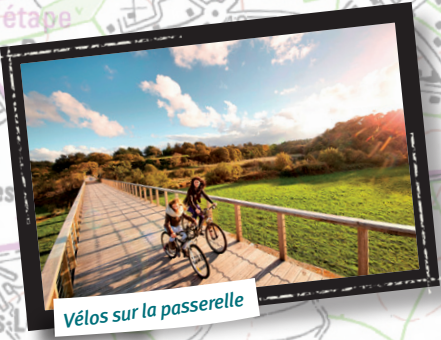
Vélos sur la passerelle