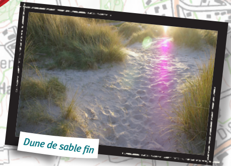
Dune de sable fin