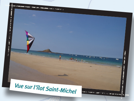
Vue sur l'îlot Saint-Michel