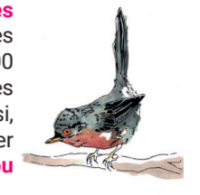
Illustration Fauvette pitchou © Alix CHEVALLIER

Les écosystèmes présents ainsi que la faune et la flore qui s'y développent sont reconnus au niveau national et européen au titre de Natura 2000. Le Cap Fréhel offre notamment l'un des plus grands ensembles de landes littorales à bruyères et à Ajonc d'Europe des côtes françaises avec une superficie d'environ 400 hectares. Il abrite aussi des espèces animales et végétales originales et spécifiques. Ainsi, aurez-vous peut-être l'occasion d'y croiser l'Engoulevent d'Europe , la Fauvette pitchou ou encore l'Azuré des mouillères .