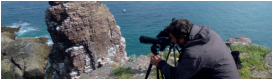
Philippe Quéré, animateur Natura 2000

Chaque année, de mars à août, un comptage scientifique est réalisé pour connaître la bonne santé des espèces présentes sur ce territoire remarquable. Le Cap Fréhel est le seul endroit en France où l'observation des pingouins torda et des guillemots de troïl est possible depuis la côte, sur leur site de nidification, les îlots de la Fauconnière.