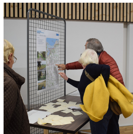
réunion publique du 21 novembre 2024