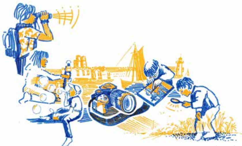
Illustration © Caroline Giron (Grand Site)