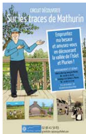
Illustrations © Emmanuel Cerisier

À PARTIR DE 8 ANS - LOCATION BESACE 3 EUROS - DURÉE : DE 1H À 3H