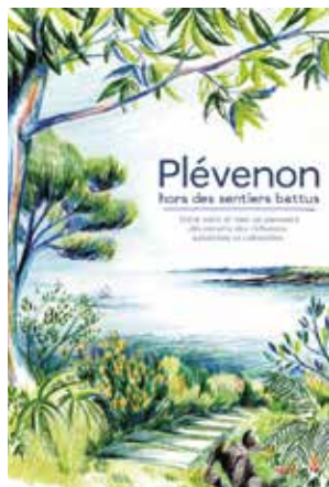
Illustrations © Emilie Gayet Création et mise en page © Atelier Bruine

Le livret vous accompagnera dans cette rencontre le temps d'un parcours riche en activités et découvertes.