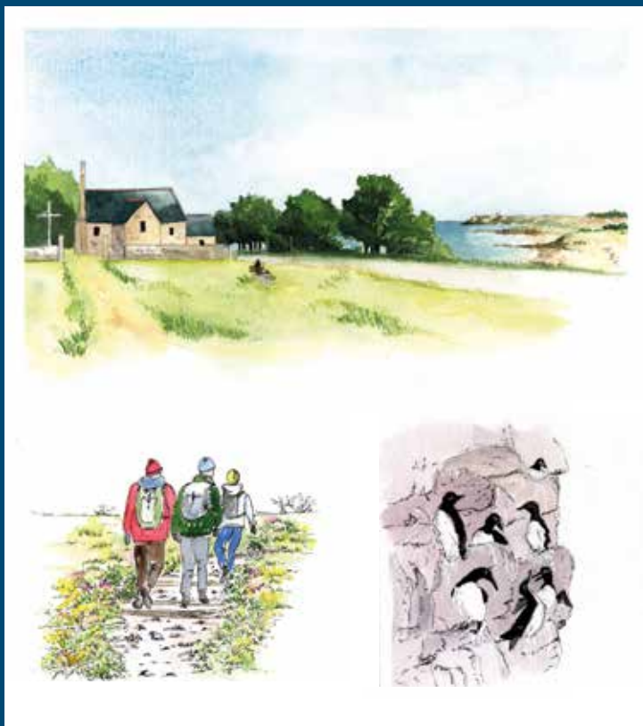
aquarelles © Emilie Gayet - Isabelle Pommier - Hedwidge Gagey

Le livre est en vente au siège du Grand Site, 18 rue Notre Dame à Plévenon et dans les Offices du Tourisme d'Erquy et Fréhel au prix de 10 euros.