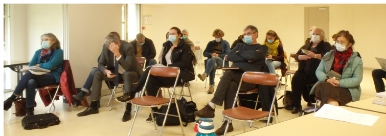
COPIL Natura 2000 de décembre

Jusqu'à maintenant, au moins 150 personnes ont participé à la consultation locale sous forme de groupes de travail, groupes techniques ainsi qu'un comité de pilotage constitué d'acteurs locaux (collectivités, acteurs socio-économiques, associations) et de services de l'Etat qui valide les grandes étapes. Plus de 30 entretiens socio-économiques ont été menés.